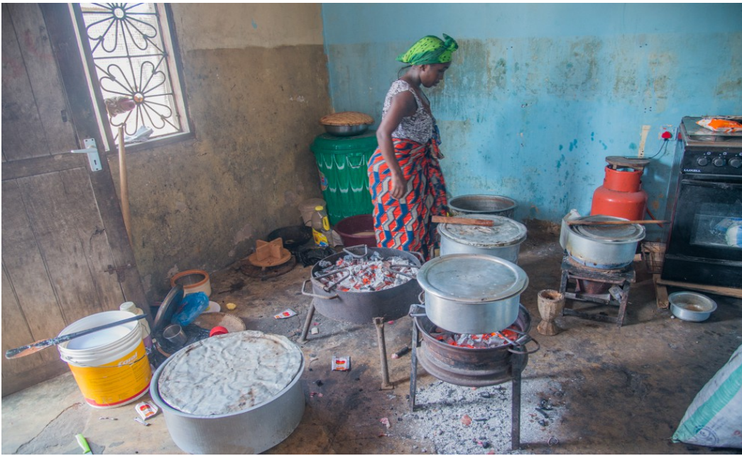
Hier wird für die Jugendlichen gekocht. Oft helfen sie dabei.