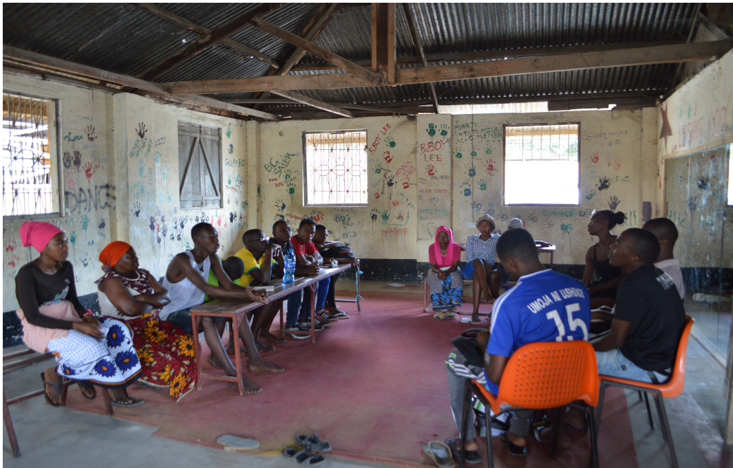
Beim Treffen mit den Jugendlichen