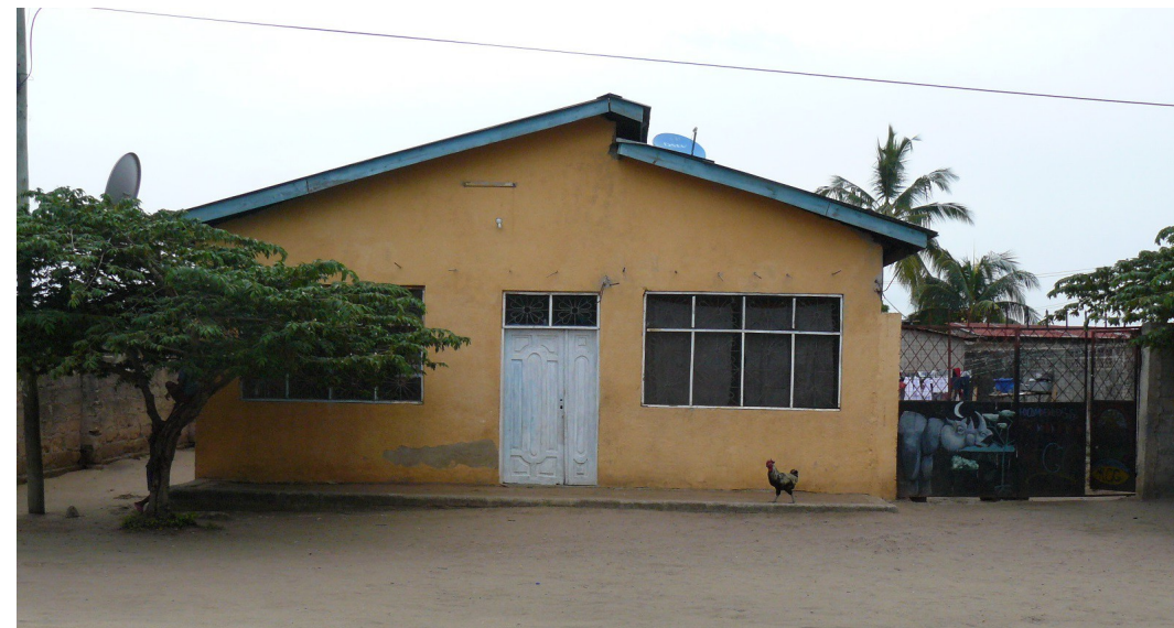
Das Haus, in dem die Jugendlichen gemeinsam leben