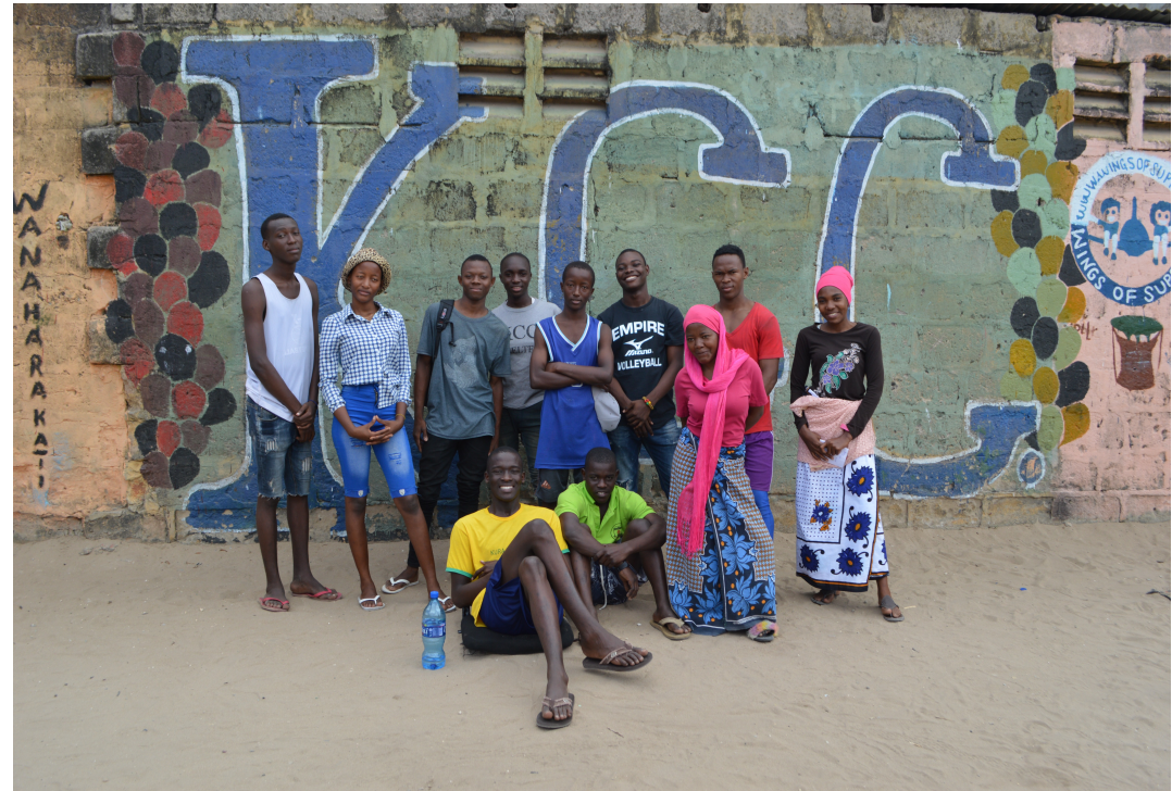
Einige der Jungen und Mädchen aus dem Scholarship Programm

Grundsätzlich zahlen die PatInnen den jeweiligen Beitrag auf das Konto von Pamoja e.V., von dort aus leiten wir es ans KCC weiter, sobald alle Scholarship-Beiträge eingegangen sind. Mit dem Geld der PatInnen wurden im vergangenen Jahr für das jeweilige Patenkind hauptsächlich Schulmaterialien (u.a. Schuluniform, Bücher) sowie die Transportkosten (d.h. die Kosten, die für das komplette Schuljahr für die Busfahrten anfallen, um zur Schule hin und zurück zu kommen) finanziert. Zusätzlich entstandene Kosten hat das KCC übernommen.