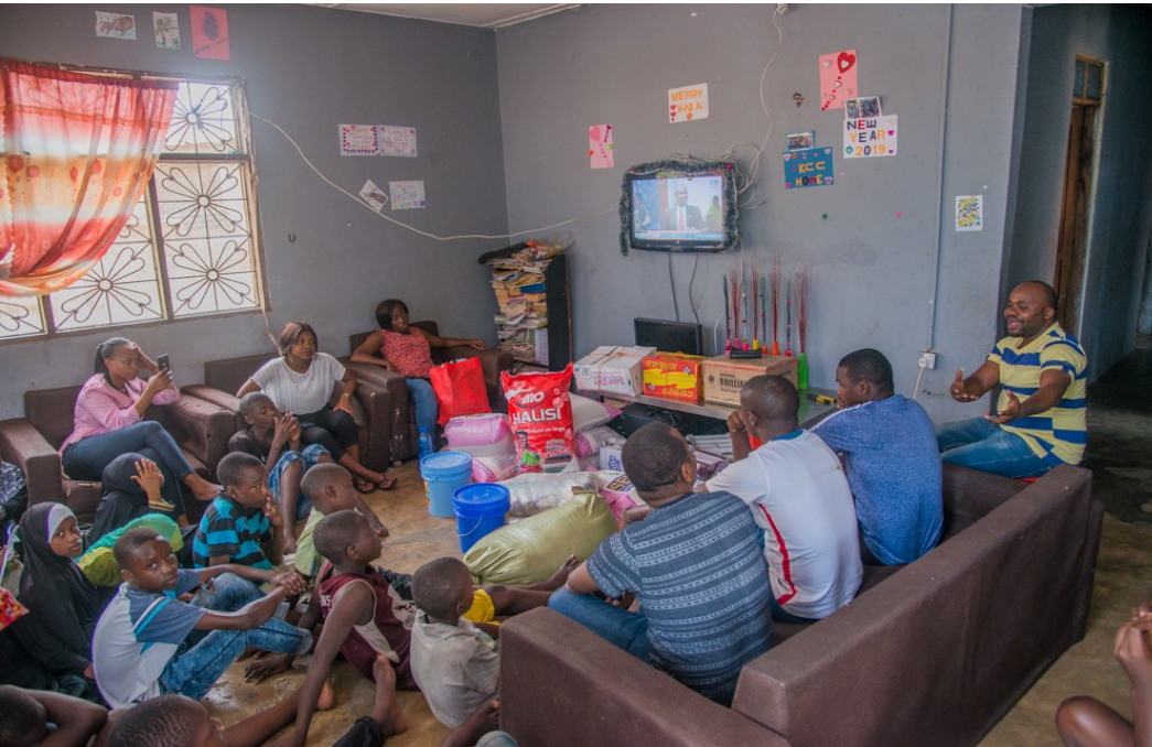
Im November 2018 hat das KCC Spenden in Form von Nahrung und Hygieneartikeln für das Shelter von einer Privatpersonen erhalten.